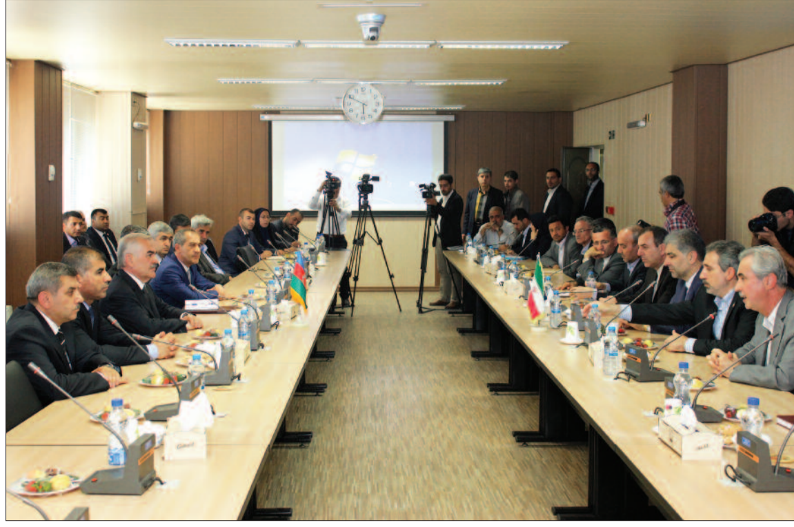
100-ə yaxın universiteti ilə əlaqəsi vardır. Ali təhsil ocağında dünyanın bir çox ölkələ-

Naxçıvan Muxtar Respublikası Ali Məclisinin Sədri Vasif Talıbov elm və təhsilin inkişafının, eləcə də bu sahədə qarşılıqlı əlaqələrin qurulmasının vacibliyini bildirərək demişdir: Muxtar respublikada təhsilin bütün pillələri, xüsusilə də ali təhsilin inkişafı təmin edilmiş, müasir tədris imkanları yaradılmışdır. Naxçıvan Dövlət Universitetinin dünyanın